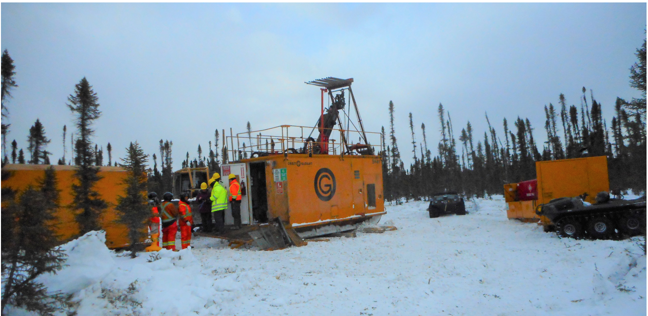
Abb. 1: Instrumentenschulung / Einführungsgespräch am ersten Bohrstandort; Orbit Garant in der Nika-Zone

29. März 2019 - Montreal (Quebec): Maple Gold Mines Ltd. ("Maple Gold" oder das "Unternehmen") (TSX-V: MGM, OTCQB: MGMLF; Frankfurt: M3G - https://www.commodity-tv.net/c/search_adv/?v=298248 ) hat offiziell mit den Bohrungen mit dem ersten Bohrgerät von Orbit Garant begonnen, das sich derzeit in einer Tiefe von 125 m im Bohrloch befindet (siehe Abb. 2 zur Ansicht des Bohrkerns), am ersten Bohrplatz in der Nika-Zone. Dieses erste Bohrloch, DO-19-255, zielt auf die oberflächennahe Erweiterung des besten Abschnitts des letzten Jahres in der Nika-Zone (Loch DO-18-218), der 50 Meter mit durchschnittlich 1,77 g/t Au zurücklegte (siehe Pressemitteilung vom 14. Mai 2018). Das zweite Bohrloch wird die Tiefenkontinuität des gleichen Abschnitts testen, wobei in diesem Bereich zusätzliche Löcher geplant sind, um andere nahegelegene höherwertige Ziele zu testen.