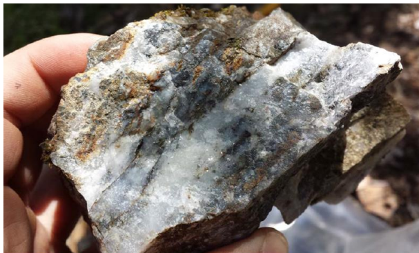
Quarzprobe aus historischer Mine Providence.

Bei früheren Prospektionsarbeiten durch Ximens Teams wurde eine Reihe von Mineralvorkommen identifiziert, die in den Minfile-Aufzeichnungen nicht erwähnt wurden. Bei einem handelt es sich um eine Grubenhalde in der Nähe der historischen Mine Providence, von der eine Probe bedeutende Gold- und Silberwerte (2,87 Gramm Gold pro Tonne und 127 Gramm Silber pro Tonne) aufwies. Ein anderes nicht dokumentiertes Vorkommen ist eine Erkundungsgrube, in der massives Sulfidmaterial mit Chalkopyrit, Bornit und Magnetit zutage tritt. Eine Probe dieses Materials ergab Werte von 2350 ppm Cu und 3,4 ppm Silber.