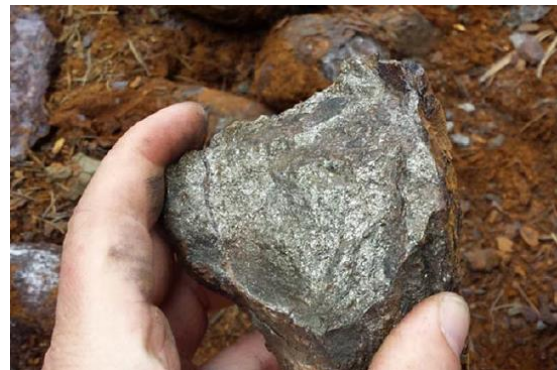
Massivsulfid aus historischer Grube.