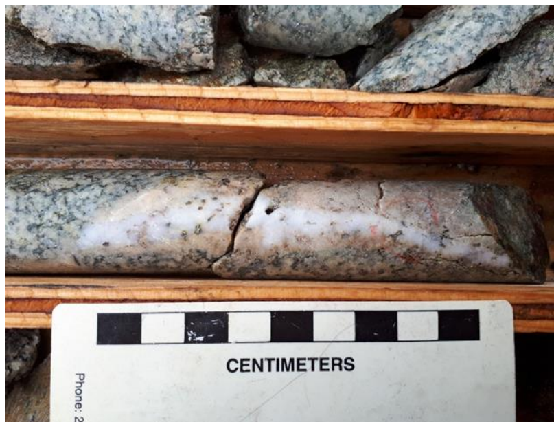
Photo of drill core from Superior/Lucky Todd showing granodiorite hosting a quartz veinlet (white) mineralized with chalcopyrite grains (note: pink mineral is potassium feldspar)

Vancouver, B.C., 2. Januar 2020. Ximen Mining Corp. (TSX.v: XIM) (FRA: 1XMA) (OTCQB:XXMMF) (das „Unternehmen“ oder „Ximen“ - https://www.commodity-tv.com/?id=88&tx_kesearch_pi1%5Bsword%5D=ximen ) informiert über aktuelle Entwicklungen aus dem Silberkonzessionsgebiet Treasure Mountain, das derzeit im Rahmen einer Optionsvereinbarung von New Destiny Mining Corp. (TSX.v: NED) bearbeitet wird. Die Ergebnisse der Bohrungen, die in der vergangenen Saison in seinem Silberkonzessionsgebiet Treasure Mountain unweit von Tulameen (BC) absolviert wurden, sind eingegangen.