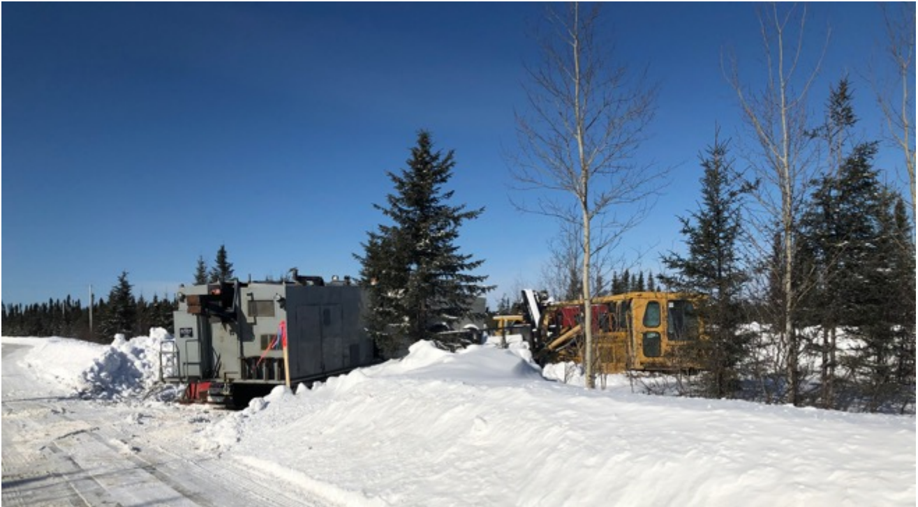
Abb. 2: Bohrer, der vor Ort eintrifft und in die NW-Zone mobilisiert wird.