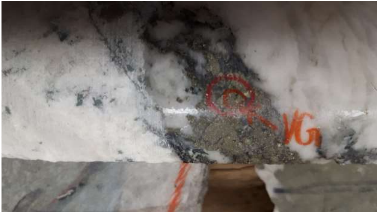
Fotos von typischen Bohrkernabschnitten aus dem Erweiterungsprogramm der Kenville-Mine zeigen sichtbares Gold in einer Pyrit-Mineralisierung.

Dieses Portal wird den Zugang zum 257 Level der Kenville-Mine ermöglichen, der später genutzt werden soll, wenn er durch ein Aufhauen mit dem neuen Tunnel verbunden wird. Das Aufhauen wird errichtet, sobald der Tunnel unterhalb der Mine voranschreitet, und wird für die Belüftung und einen zweiten Ausgang aus der Mine sorgen.