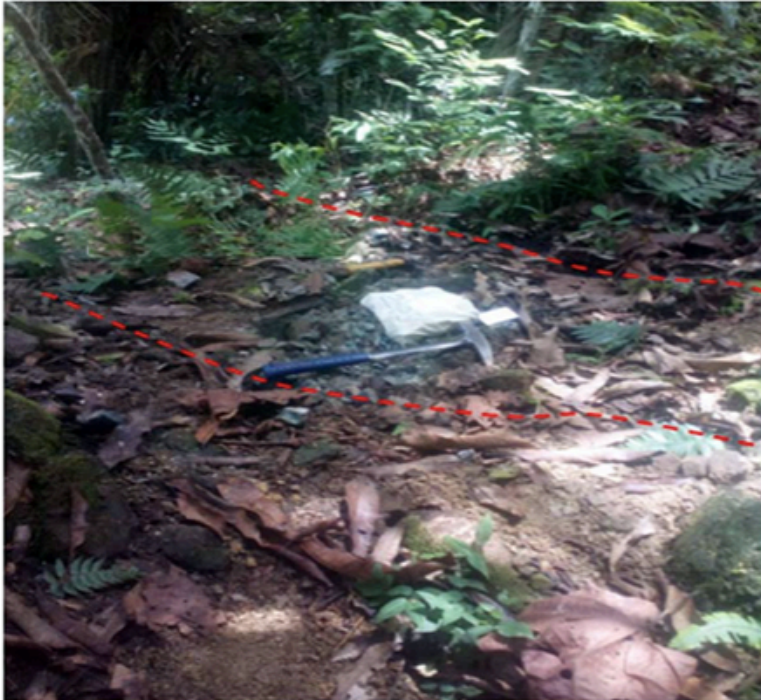
Photo of Outcrop D. The width of the zone with visible copper oxides assayed 0.8 metres @ 2.8% copper and 14 g/t silver (the zone is partially sampled and needs further sampling on the margins)

offenen asymmetrischen Antiklinale um 25 Grad nach Westen einfällt, befindet sich unmittelbar stromaufwärts eines Baches, wo 10 mineralisierte Schürfproben von Felsblöcken zwischen 5,0 % Kupfer und 36 g/t Silber bis 0,4 % Kupfer und 3,9 g/t Silber sowie durchschnittlich 2,7 % Kupfer und 16,9 g/t Silber ergaben.