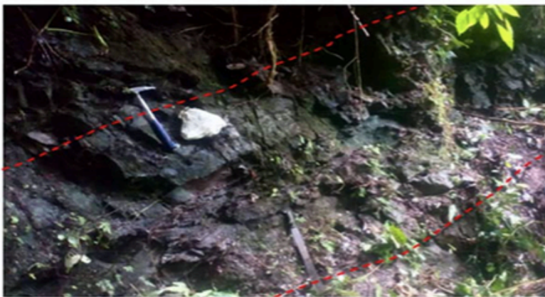
Photo of Outcrop E. The entire reduced zone assayed 2.5 metres @ 0.8% copper and 14 g/t silver (one bulk sample taken across entire zone)