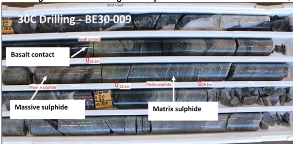
Abbildung 2: 30C Nickel-Trog-Schnittpunkt für Bohrloch BE30-009. 28,1m - 29,4m, 1,32m @ 7,7% Ni

1. Bohrlochdicke. Die tatsächliche Mächtigkeit kann mit den verfügbaren Informationen nicht abgeschätzt werden.