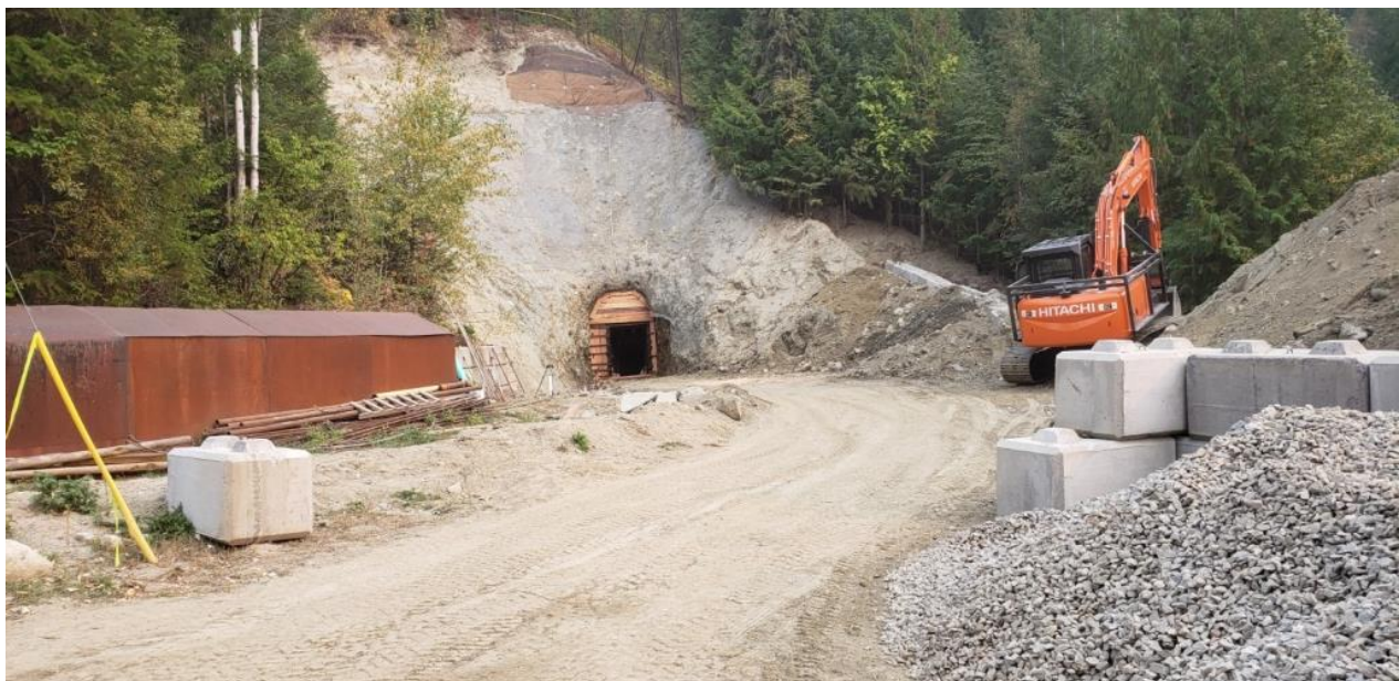
Foto: Portal 257 der Mine Kenville und Schotterhalde für die Bettung (rechts).