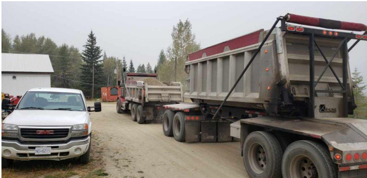
Foto: Ankunft des LKW mit dem Schotter für die Bettung des Durchlasses in der Mine Kenville

Die Arbeiten konzentrieren sich nun auf die Verlegung der Bettung und die Platzierung des neuen Stahldurchlasses außerhalb des unterirdischen Zugangs (siehe Fotos unten).