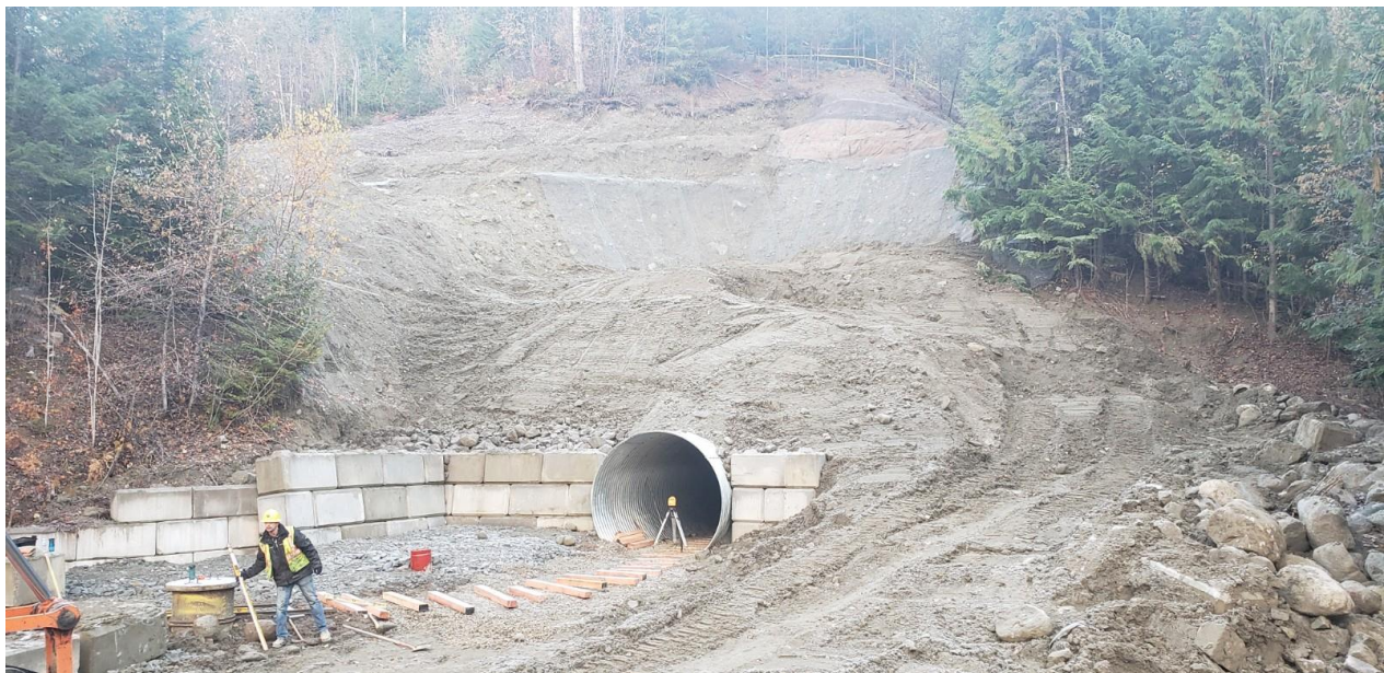
Foto des neuen Abzugskanals mit erstem Versatz und Stützmauer aus Zementblöcken am Portal 257 auf Kenville.

Sobald das Versatzmaterial eingebracht ist, wird eine Bestandsaufnahme erfolgen, die der beratende Ingenieur unterzeichnen wird.