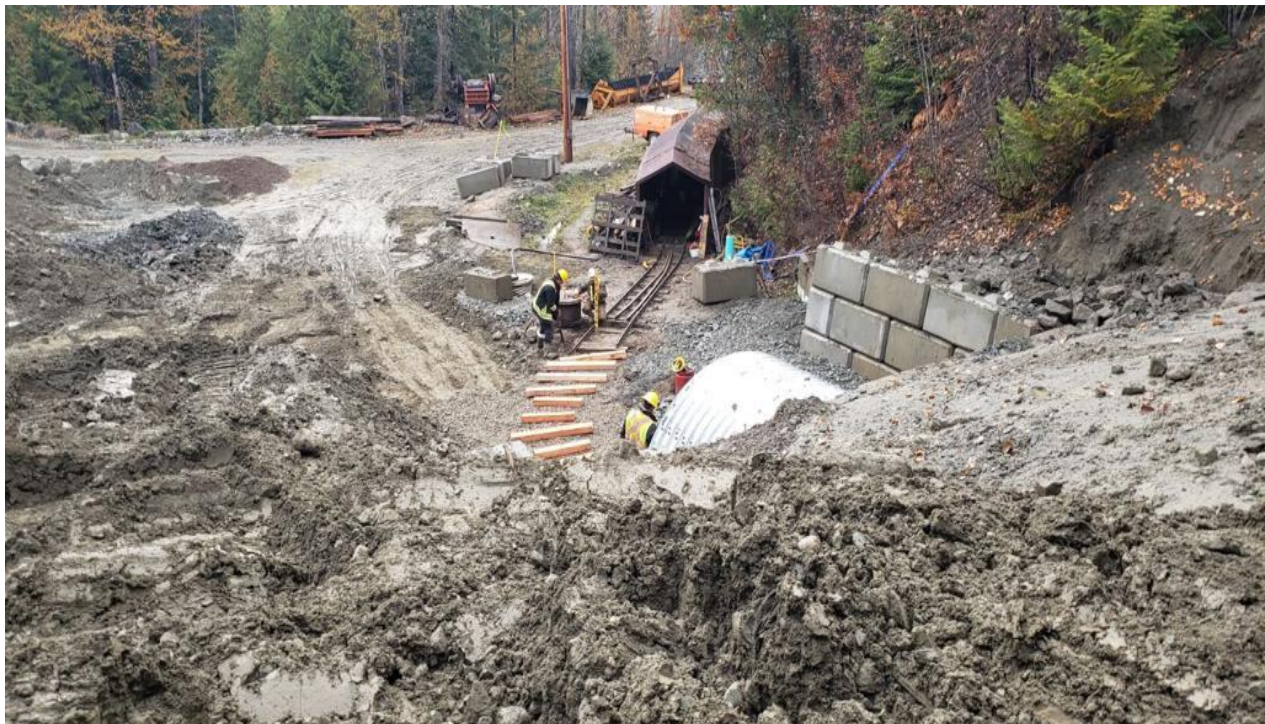
Foto der Crew, die Schienen außerhalb des neuen Abzugskanaleingangs am Portal 257 auf Kenville verlegen.

Die Arbeiten am Portal 257 sind gut gelaufen und jetzt in der Endphase. Der Abzugskanal wurde gebaut und auf das Schotterbett platziert. Stützmauern aus Zementblöcken wurden gebaut und der Versatz ist fast eingesetzt. Außerdem wurden Schienenbefestigungen und Gleise im Bereich des Portal-Abzugskanals gelegt und sollen eine Verbindung zur Mine ergeben (siehe Fotos unten).