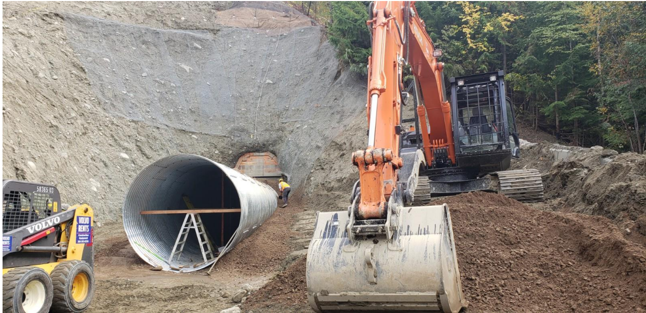
Foto des Abzugskanals, der am Portal 257 auf Kenville gebaut wurde.