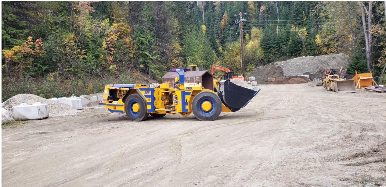
Foto des neuen Untertage-Frontladers (3-Yard-Kapazität), der im Oktober zur Mine Kenville gebracht wurde.

Die Genehmigungen machen Fortschritte und die öffentliche Bekanntgabe ist abgeschlossen. Auch andere, kleinere Zusätze zur Beantragung der Genehmigung sind erfolgt. Ein aktualisierter Antrag wird in wenigen Tagen an das Bergbauministerium geschickt.