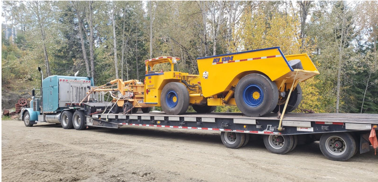
Foto eines LKW, der mit Ausrüstung für den Untertageabbau auf der Mine Kenville ankommt (Bohrer vorne, Schüttlastler hinten).