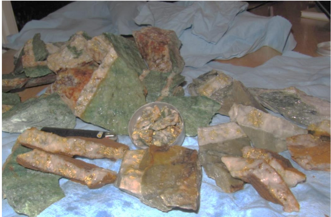
Foto 2: Grobes freies Gold in Quarz aus einer der Adern auf dem Grundstück Rivard

Bill Paterson, Head of Exploration bei Trillium Gold, erklärt: "Diese erste Bohrphase ist ein wichtiger Schritt zur Erweiterung unseres Verständnisses der Auswirkungen dieser strukturellen Abschnitte auf die Zone Newman Todd. Sie erweitert auch unsere aktive Exploration in bekannten Gebieten mit einer bedeutenden hochgradigen Goldmineralisierung. Angesichts der begrenzten Arbeiten und der nicht-traditionellen Explorationsmethoden, die seit über 20 Jahren durchgeführt werden, stellt dies eine ungewöhnlich aufregende Situation dar, wenn man bedenkt, wie vielversprechend das Goldcamp Red Lake ist".