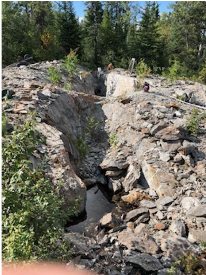
Foto 1: 80 m langer Graben auf dem Grundstück Rivard, Blick zurück nach Nordwesten entlang des Streichs einer goldhaltigen Ader

Bei Rivard kommt Gold typischerweise in den Adern als grobes, freies Gold (VG) vor, während auf dem Grundstück NT Gold