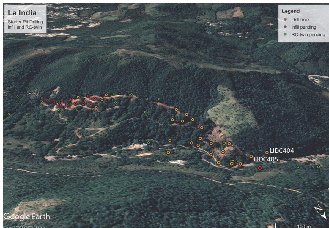
Abbildung 1. Foto zeigt die abgeschlossenen (gelb) und anstehenden (rot) Infill-Bohrungen in der Starter-Tagebaugrube La India sowie die für eine Verzwilligung vorgeschlagenen RC-Bohrungen (grün).

„Ich bin erfreut über das erste Bohrergergebnis von 9,6 m wahrer Mächtigkeit mit 3,98 g/t Gold ab der Oberfläche in Bohrloch LIDC404, da es das geologische Modell einer mächtigen Zone hochgradigen Erzes in der Starter-Tagebaugrube La India bestätigt, die innerhalb der Mineralreserve der vollständig genehmigten Haupttagebaugrube La India liegt. Die Entdeckung eines zusätzlichen Ganges mit einer wahren Mächtigkeit von 2,9 m mit 2,27 g/t Gold in einer Bohrtiefe von 24,15 m in demselben Bohrloch ist ein zusätzlicher Bonus und wird wahrscheinlich zusätzliches mineralisiertes Material für den Minenplan bereitstellen. LIDC404 verfügt über einen zusammengefassten 24,15 m langen Bohrabschnitt von 1,20 m bis 27,15 m Bohrtiefe (23,6 m wahre Mächtigkeit) mit 2,05 g/t Gold, einschließlich eines 1,8 m mächtigen Abbauhohlraums. Der Abbau in diesem Gebiet wird sich wahrscheinlich darauf konzentrieren, das hochgradige Material durch die zukünftige Verarbeitungsanlage zu schicken und das niedrighaltige Material auf Halde zu schütten oder mit höhergradigem Material von anderswo zu mischen. Es liegen bislang nur die Analyseergebnisse von 2 der 25 Bohrlöcher im Bereich der Northern Starter Pit für insgesamt 1.273 m an Infill-Bohrungen und Bohrungen zum Ersatz der RC-Bohrungen vor, die bisher in den Starter-Tagebaugruben La India niedergebracht wurden. Im Rahmen des aktuellen Bohrprogramms müssen noch Bohrungen mit einer Gesamtlänge von ca. 2.200 m niedergebracht werden.“