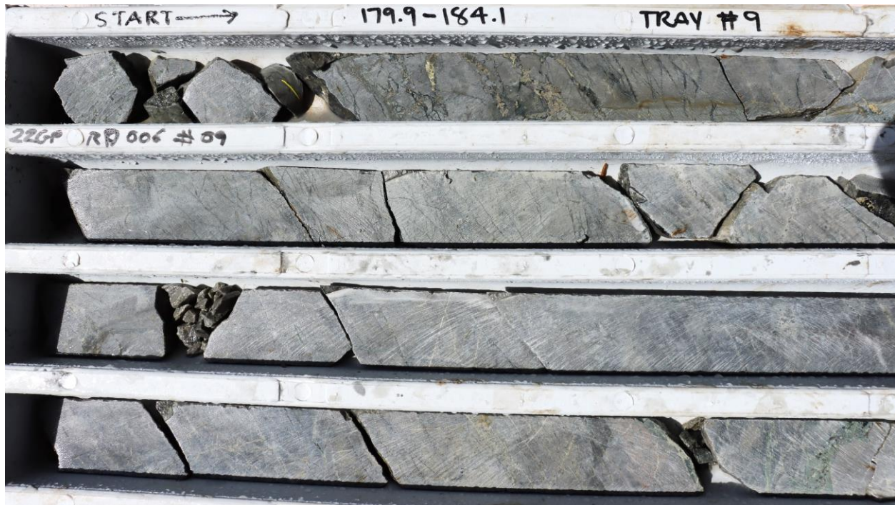
Abbildung 5: Diamantkern von Great Pyramid (22GPRC006: 179,9- ~181,5 m), unterhalb des historischen Ressourcengebiets, die Ergebnisse stehen noch aus. Eng geschichtete Chlorit-Pyrit-Chalkopyrit-Erzgänge ( \pm Turmalin) in stark silifiziertem Sandstein. Die historische Exploration legt nahe, dass Erzgänge dieses Typs auch kassiterithaltig und typisch für die Mineralisierungszone sind.