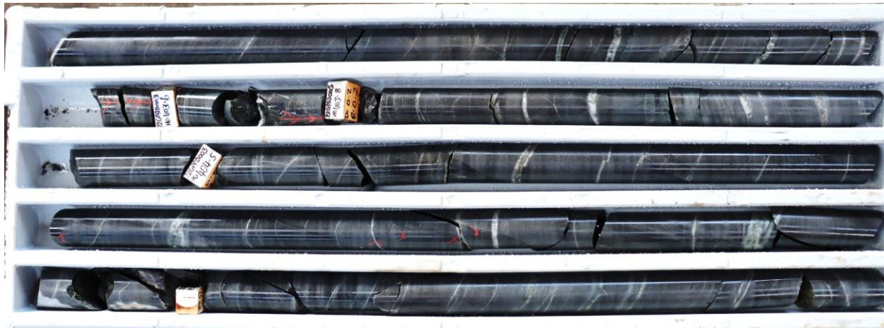
Abbildung 4: Diamantkern von Great Pyramid (22GPRC003: 403,8-406,9 m), unterhalb des historischen Ressourcengebiets, die Ergebnisse stehen noch aus. Geschichtete Quarz-Karbonat- ± Sulfid-Erzgänge in stark silifiziertem, mittel- bis grobkörnigem Sandstein. Die historische Exploration legt nahe, dass Erzgänge dieses Typs kassiterithaltig und typisch für die Mineralisierungszone sind.