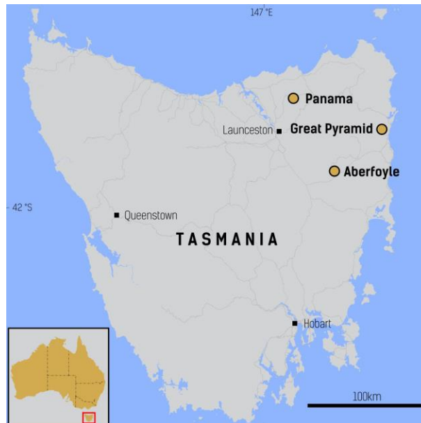
Abbildung 1: Standorte der Projekte des Unternehmens im bergbaufreundlichen Rechtssystem Tasmanien

Die bisher abgeschlossenen Diamantbohrlöcher mit ausstehenden Ergebnissen sind 22GPDD001A (Neubohrung von 22GPDD001, das bei 42,1 m aufgegeben wurde), 22GPDD008, 22GPDD10, 22GPDD015 und 22GPDD023. Die Diamantkern-Erweiterungen wurden für die RC-Pre-Collar-Bohrlöcher 22GPRC003, 22GPRC004 und 22GPRC006 durchgeführt, die Ergebnisse stehen noch aus.