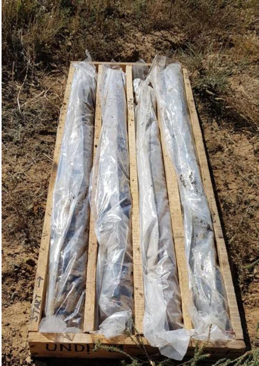
Abb. 3: Bei Urgakh Naran entnommene Kernproben