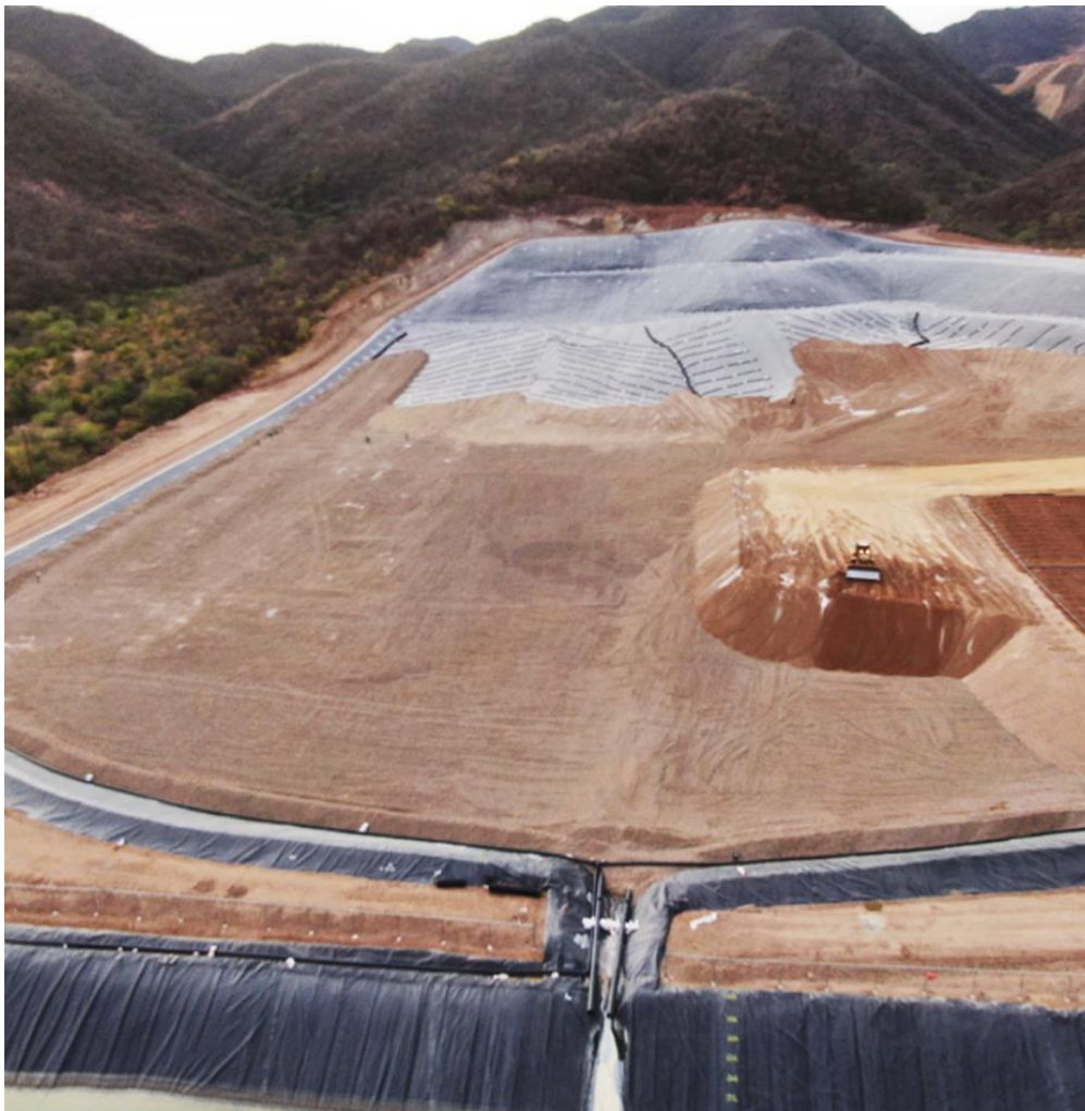
Abbildung 5: Halde auf dem neu errichteten Länderraum