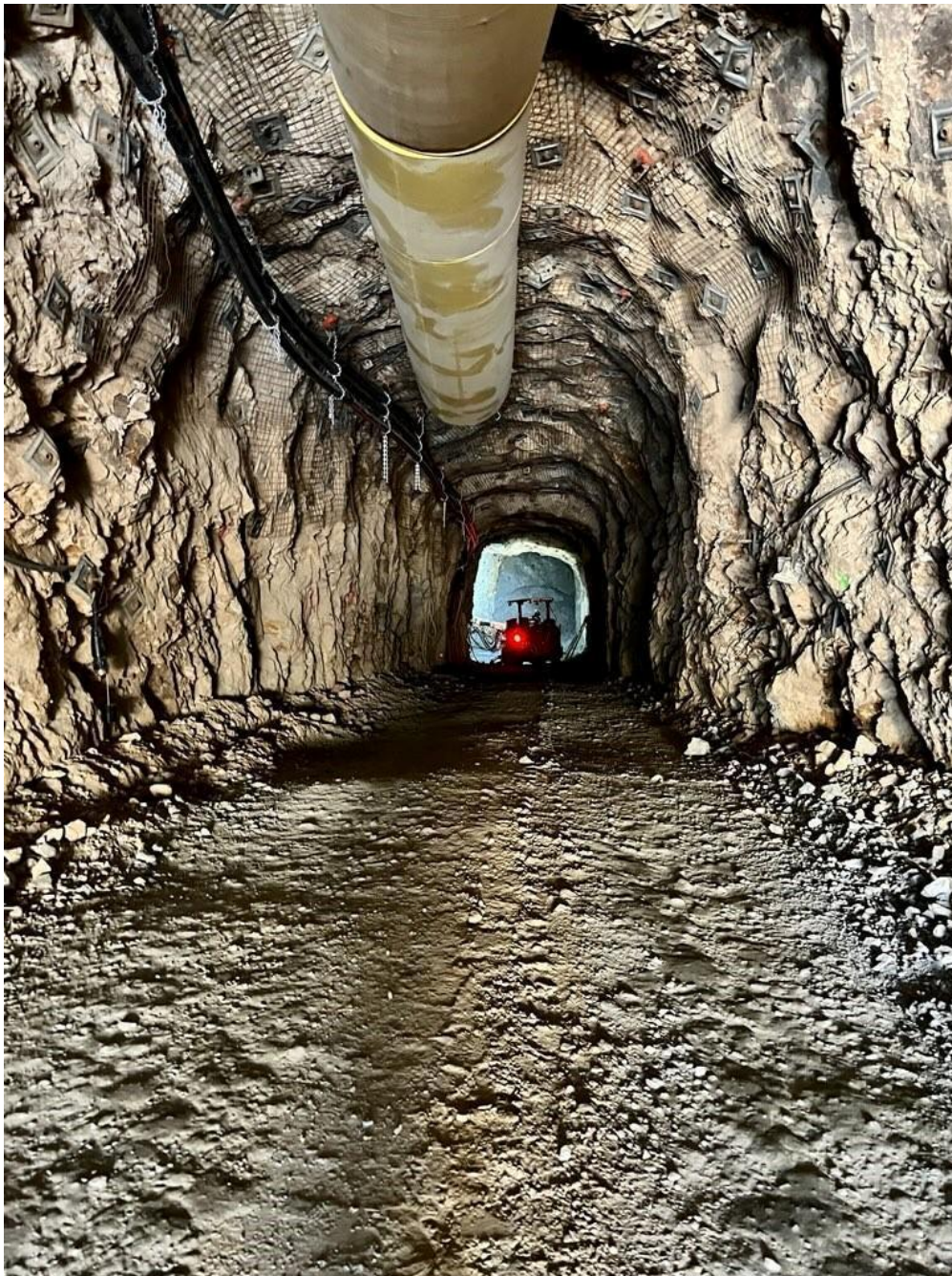
Abbildung 2: Trixie Abgang