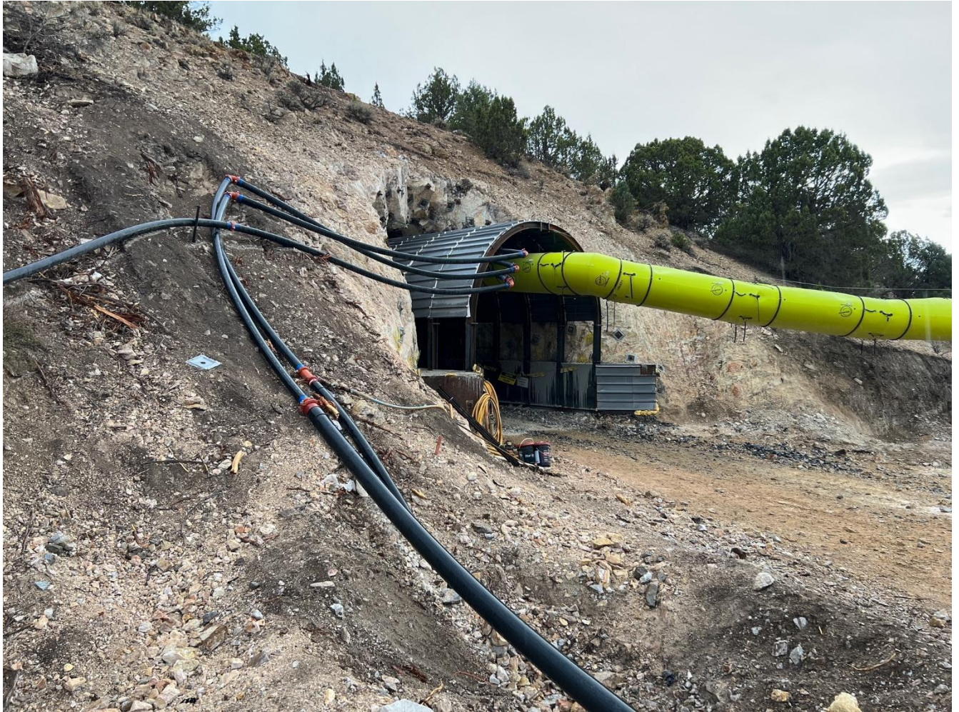
Abbildung 1: Trixie-Portal