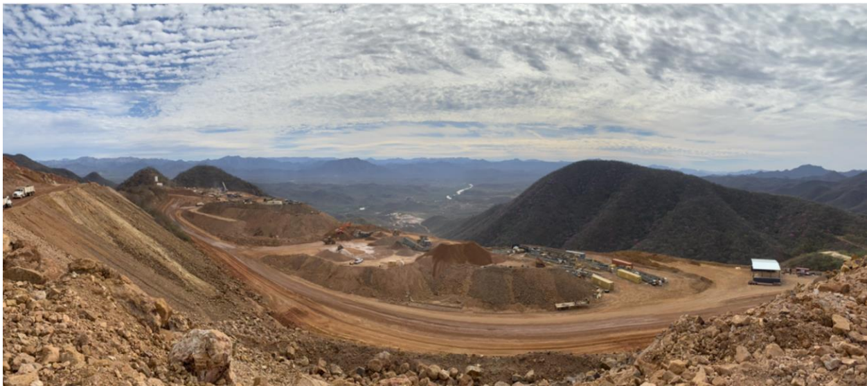
Abbildung 4: Zerkleinerung der Halde in San Antonio

Das im mexikanischen Bundesstaat Sonora gelegene Goldprojekt San Antonio umfasst fünf bekannte Lagerstätten und mindestens ein Dutzend weitere Goldexplorationsziele auf 11.338 Hektar. Eine aktuelle Mineralressourcenschätzung (siehe Pressemitteilung vom 30. Juni 2022) umfasst 576.000 Unzen Au und 1,37 Millionen Unzen Ag (14,9 Millionen Tonnen mit einem Gehalt von 1,2 g/t Au und 2,9 g/t Ag) in der angezeigten Mineralressourcenkategorie sowie 544.000 Unzen Gold und 1,76 Millionen Unzen Silber (16,6 Millionen Tonnen mit einem Gehalt von 1,0 g/t Au und 3,3 g/t Ag) in der abgeleiteten Mineralressourcenkategorie. Die Goldmineralisierung des Projekts San Antonio ist durch hydrothermale Brekzien gekennzeichnet, die einen etwa 3.000 Meter langen, von Osten nach Nordosten verlaufenden Mineralisierungskorridor mit der Kupferlagerstätte Luz del Cobre im Osten bilden.